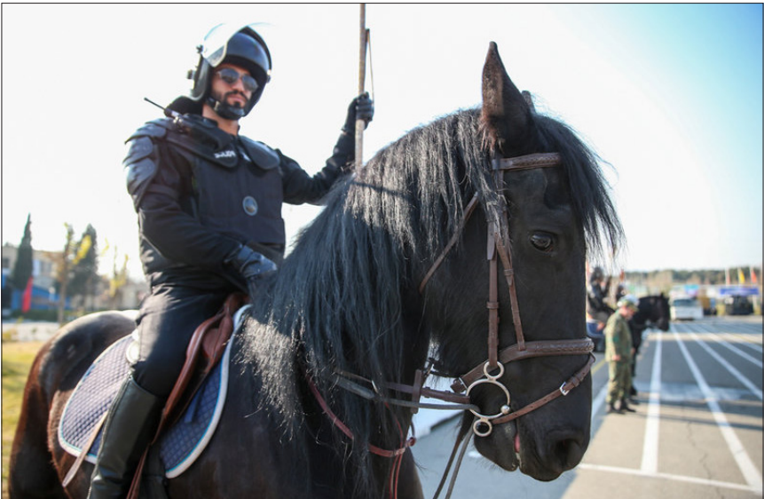
رونمایی از تجهیزات