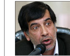
محمدرضا باهنر که پس از هفت دوره حضور در خانه ملت از ثبت‌نام در دهمین دوره مجلس شورای اسلامی خودداری کرد، خطاب به اعضای جبهه پیروان خط امام و رهبری پیامی صادر کرد.

در این پیام آمده است: فکر می‌کنم بعد از حضور ۲۸ ساله در مجلس که کاملاً غیر معمول است لازم بود، اولاً زمینه برای ورود افراد مومن، توانمند و پرنرزی فراهم و تبلیغ شود.