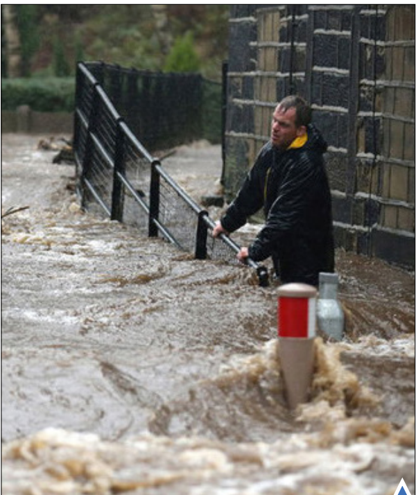
طوفان و وزش بادهای سهمگین در جنوب آمریکا تاکنون موجب مرگ دست کم ۲۶ نفر شده است.

طالبان همچنین دچار اختلاف‌هایی داخلی در مورد کار رهبری و برگزاری مذاکرات صلح شده است. این دو موضوع، تمرکز طالبان را بر جنگ در هلمند تضعیف می‌کند. اگر نیروهای دولتی افغانستان نتوانند مشکلات خود را در خصوص فساد و فرسایش مهار کنند، متوقف کردن کنترل طالبان بر هلمند دشوار و حتی غیر ممکن خواهد بود. حتی اگر طالبان نتوانند پیشروی‌هایی که تاکنون داشته است تثبیت کنند، همین برای این گروه کافی خواهد بود تا هلمند را به پایگاهی مهم برای خود، فشار بر نیروهای دولتی و منابع دولت مرکزی در سال‌های آینده تبدیل کند.