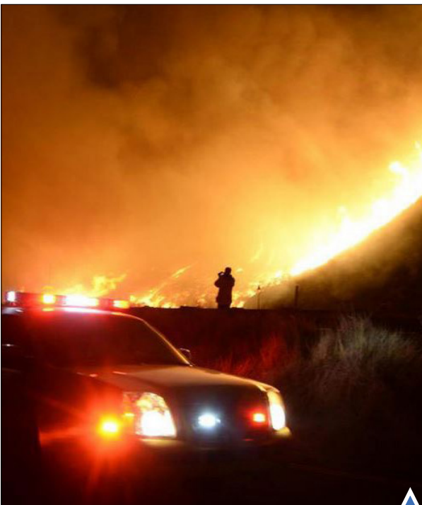
بروز آتش سوزی در جنوب کالیفرنیا، به ۱۰۰۰ جریب از زمین‌های منطقه آسیب زده است.

وقوع سیل شدید در شهرهای مختلف انگلیس موجب تخلیه صدها خانه و وارد عمل شدن ارتش برای کمک به شهروندان سیل زده شده است.