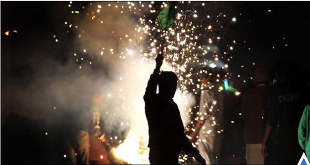
جشن میلاد حضرت محمد (ص) در لاهور پاکستان.