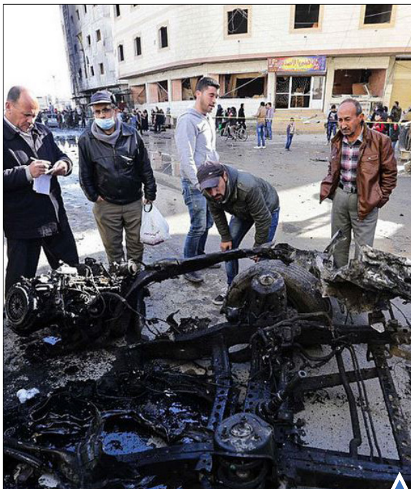
وقوع دو انفجار تروریستی در منطقه زنبیه در خارج از دمشق، دست کم ۶۰ کشته بر جای گذاشت.

برودت شدید هوا در شهر کینهوانگدوی چین، موجب یخ زدن بخش ساحلی دریای بوهای در استان هبی شده است.