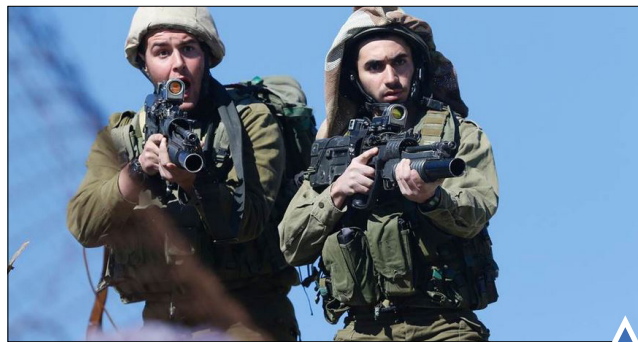
واکنش دو پلیس مرزبان رژیم صهیونیستی به تحرکات فلسطینیان در کرانه باختری.