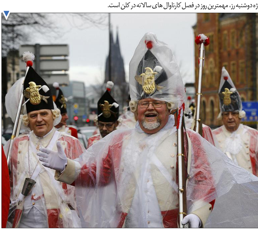
رژه دوشنبه رز، مهمترین روز در فصل کارناوال‌های سالانه در کلن است.