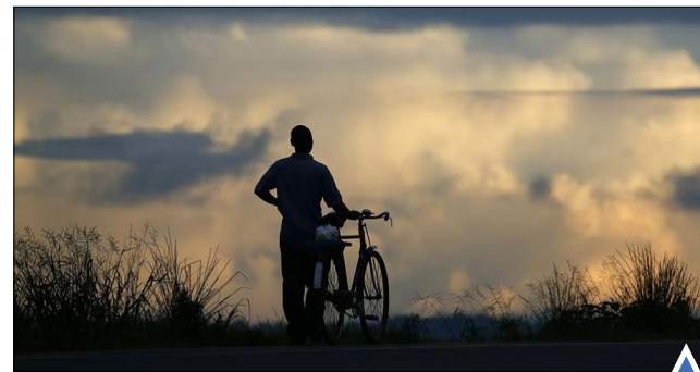
سیل و خشکسالی در اثر پدیده ال نینو در جمهوری مالاوی.