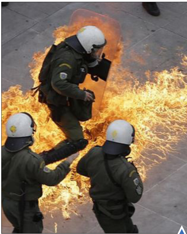
پرتاب بمب بنزینی دست‌ساز توسط معترضان یونانی در آتن.