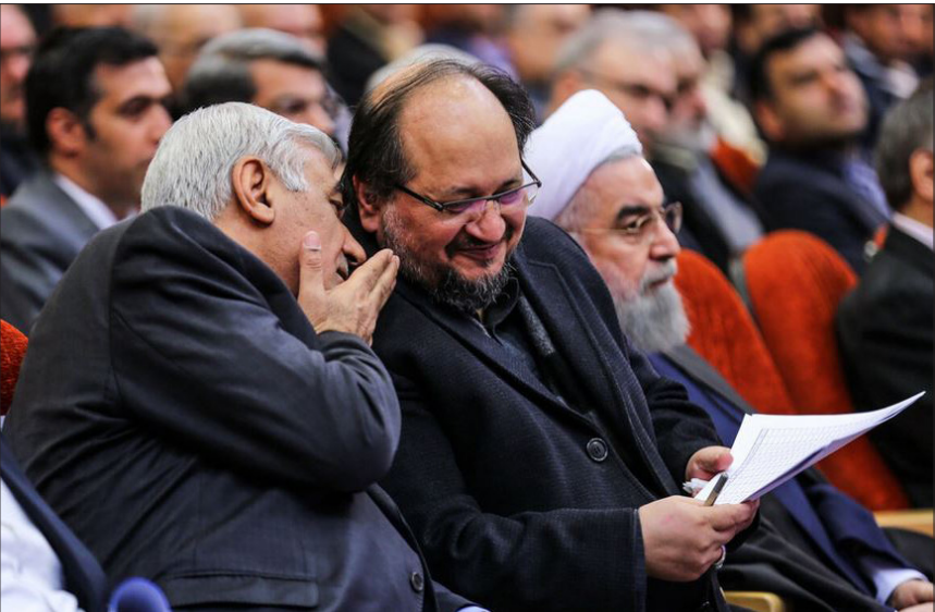
در حاشیه افتتاحیه

آفتاب نوشت: بایکوت اعطای نشان لیاقت به تیم هسته‌ای در تلویزیون ای‌مهری‌ها نسبت به تیم‌مذاکره‌کننده هسته‌ای همچنان ادامه‌دار حتی حالا که توافقی انجام شده و برجام در حال اجرایی شدن است. حالا صداو سیما به عنوان رسانه ملی تشخیص می‌دهد که مراسم اعطای نشان عالی لیاقت و شجاعت به دست‌اندرکاران برجام را پخش مستقیم نکند.