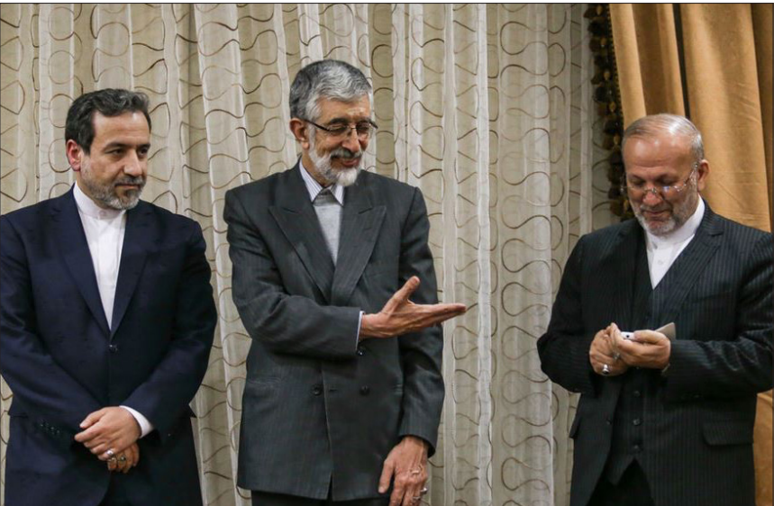
مراسم روز جمهوری