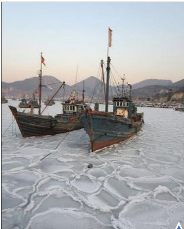
قایق‌های ماهیگیری در دریای منجمد شده استان شاندونگ چین.

کشورهای قاره آمریکا برای مقابله با شیوع ویروس خطرناک زیکا که از طریق پشه آندس منتقل می‌شود، اقدامات گسترده‌ای را آغاز کرده‌اند.