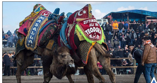
جشنواره مبارزه شترها در ترکیه.