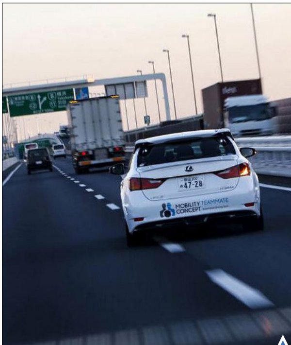
تکنولوژی خودروهای بدون راننده و تست این نوع خودروها در ژاپن انجام گرفت.

اسکات کلی، فضانورد آمریکایی که به تازگی از ایستگاه فضایی بین‌المللی به زمین برگشته زندگی ۳۴۰ روزه خود در فضا را به تصویر کشیده است.