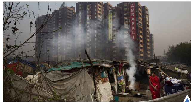
فقر و فلاکت در جوار پایتخت هندوستان! وضعیت وخیم آوارگان در مرز یونان و مقدونیه!