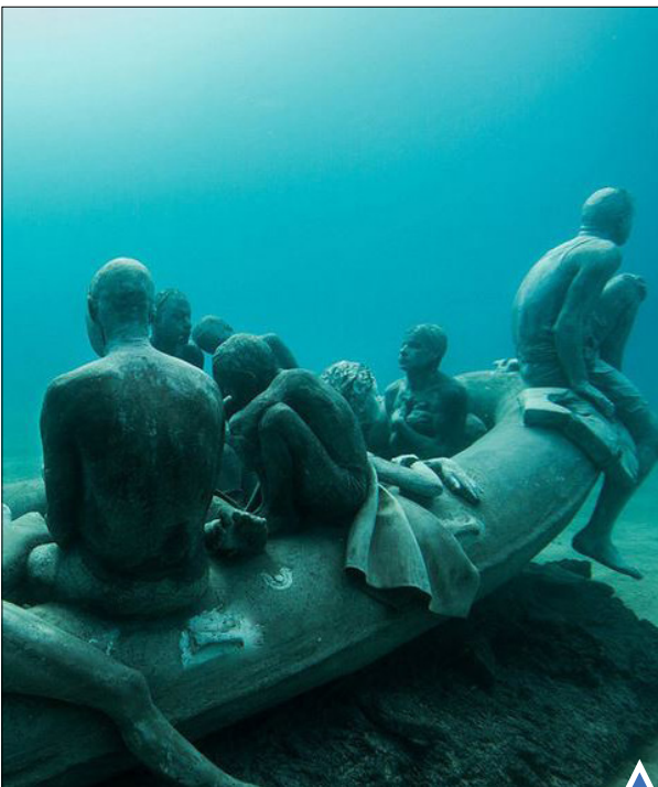
هنرمند جیسون تیلور توانسته با مجسمه سازی در زیر آب اثر زیبایی را به جا بگذارد.

این پدیده در بخش‌های بزرگی از جنوب شرق آسیا قابل مشاهده است. اما در شهر پلمبتنگ اندونزی خورشید گرفتگی بیشتر از نقاط دیگر صورت می‌گیرد.