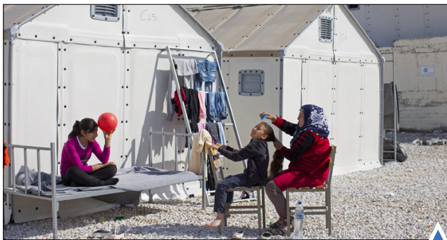
اردوگاه پناهندگان در یونان. اندوه بازماندگان، دو سال پس از ناپدید شدن هواپیمای مالزی.