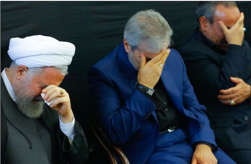
اشک ماتم رئیس جمهور در سوگ مادر! مراسم سالگرد درگذشت والده مکر مه رئیس جمهوری در سرخه: سمنان برگزار شد.