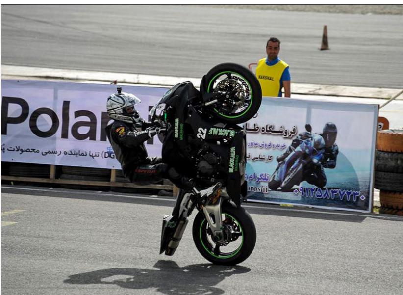
آخرین دوره مسابقات کشوری موتورسواری ریس در سال نود و چهار در پیست اومیلیرانی و موتورسواری آزادی واقع در ضلع غربی مجموعه ورزشی آزادی برگزار شد.