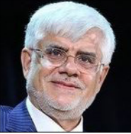
رئیس بنیاد امید ایرانیان با ارائه پیشنهادی

به جریان رقیب اصلاحات، گفت: اصلاح طلبان حاضرند با حفظ هویت خود برای تقویت مشترکات بین دو جریان سیاسی با رقیب خود تعامل و گفت‌وگو کنند.وی ادامه داد: همه گروه‌های سیاسی باید از حاشیه‌سازی و پوراختن به حاشیه‌ها و درگیری‌های بی‌حاصل جناحی پرهیز کنند. عارف با مخاطب قرار دادن اصلاح طلبان گفت: جریان اصلاح طلب باید در راه رسیدن به اجماع وحدت و به حداقل رساندن اختلافات احتمالی درون گروهی تلاش کنند.رئیس بنیاد امید ایرانیان تاکید کرد: اصلاح طلبان حاضرند با حفظ هویت خود برای تقویت مشترکات بین دو جریان سیاسی با رقیب خود تعامل و گفت‌وگو کنند به شرطی که رقیب این پیشنهاد را با حسن نیت بپذیرد.