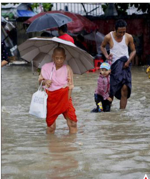
در پی جاری شدن سیل در میانمار دست کم ۲۷ نفر کشته شدند و چندین روستا و باغ در حالی به زیر آب رفت که هنوز بارش باران ادامه دارد.

مهاجران در کاله با گذشتن از حصارهای ایجاد شده سعی دارند خود را به کامیون‌هایی برسانند که از طریق تونل منتهی به بریتانیا می‌روند. به گفته پلیس اخیراً یکی از این مهاجران در تلاش برای رسیدن به بریتانیا جانش را از دست داد.