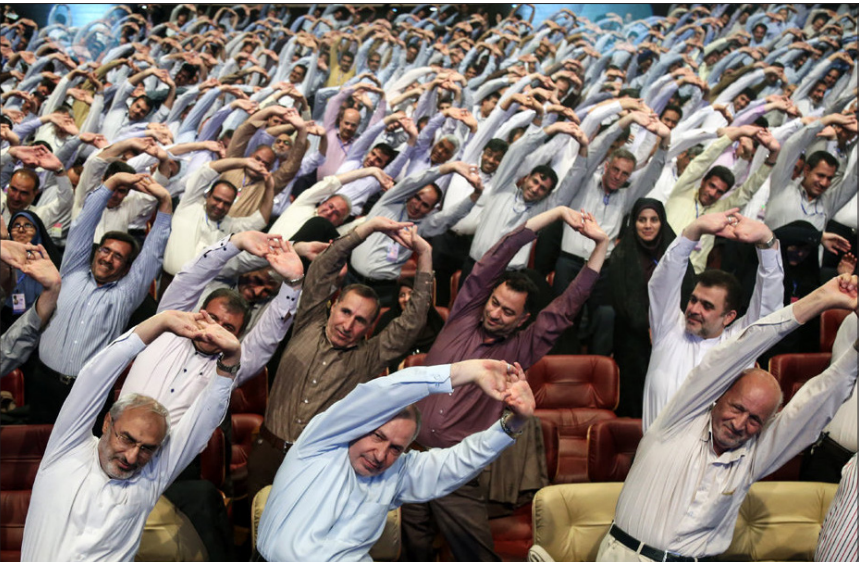
سی و دومین اجلاس