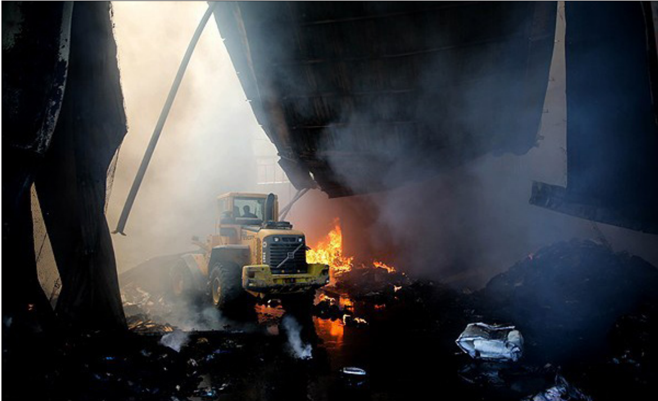
عکس و مکث

این تصویری از یکی از آتش سوزی‌هایی است که هر روزه در گوشه و کنار کشورمان رخ می‌هد و سرمایه‌برخی را خاکستر می‌کند؛ البته شاید صاحب این انبار کالا دور اندیشی کرده باشد و اکنون بتواند روی بازگشت سرمایه‌اش از محل بیمه حساب کند ولی آیا تجهیز انباری که پر از کالاهای قابل احتراق است، دوراندیشانه‌تر نیست؟ مگر نه اینکه از قدیم «احتیاط» شرط عقل است؟!