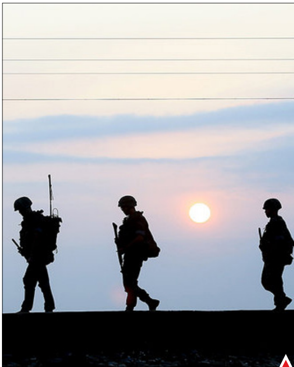
گشت زنی تفنگداران نیروی دریایی کره جنوبی در جزیره پنوینونگ.

لیس بریتانیا از کشته شدن چندین نفر بر اثر سقوط یک هواپیمای جت تک سرنشین در حاشیه نمایش هوایی خبرداد. این هواپیمای احتمالاً از نوع جنگنده جت هاکر هانتز (Hawker Hunter) است. در حاشیه نمایش هوایی «شورهام» در نزدیکی شهر برایتون دچار مشکل شد و در بزرگراه سقوط کرد.