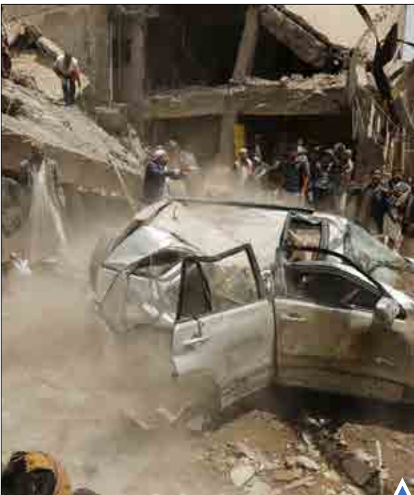
حمله جنگنده‌های عربستان به شهر «الحجه» واقع در غرب یمن به کشته شدن بیش از ۳۰ نفر و زخمی شدن ده‌ها نفر دیگر منجر شد.

الکسیس سیراس در پی پیروزی حزب خود سیریزا در انتخابات روز یکشنبه این نتیجه را به عنوان پیروزی مردم ستایش کرده است. او گفت که یونان با مسیری دشوار روبه‌روست و بهبودی از بحران مالی فقط با سختکوشی ممکن است.