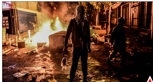
جمعه شب خیابانهای شهر استانبول ترکیه یک سر باز رژیم اسرائیل، یک پسر فلسطینی شاهد برپایی تجمع‌های اعتراض آمیز رو اسیر کرده و زنان و دختران برای نجات او، علیه دولت و به طرفداری از پ.ک.ک بود.