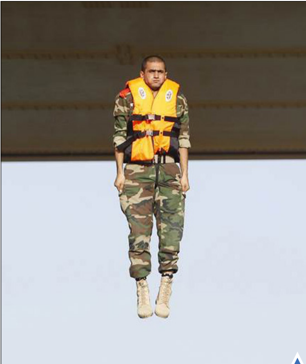
دانشجوی دانشکده افسری ارتش عراق در هنگام تمرین پرش از ارتفاع (یک پل) در حومه بغداد.

حجاج بیت‌الله الحرام در روز عرفه؛ یعنی نهم‌ذی‌حجه، از ظهر تا مغرب شرعی در سرزمین عرفات حضور می‌یابد و در اصطلاح فقهی، این حضور «وقوف» نامیده می‌شود.