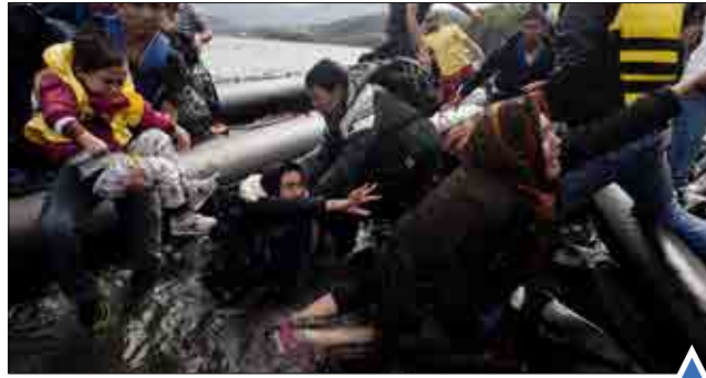
مهاجران سوری در حال عبور از دریای اژه برای رسیدن به خاک سوریه در شرایط بسیار دشوار! سوماترا - اندونزی