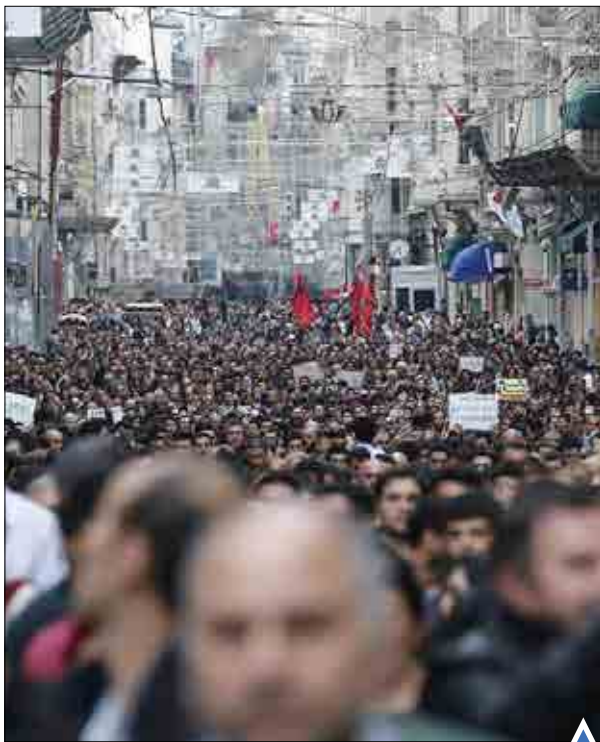
تظاهرات مردم ترکیه در استانبول؛ معترضان خواستار استعفای اردوغان شدند.

عکس جدید از تلفات و انفجار انتحاری در جریان برپایی راهپیمایی صلح در مرکز شهر آنکارا که به مرگ حدود ۱۰۰ تن منجر شد.