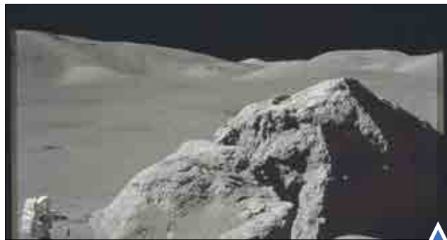
ناسا تصاویری از صخره‌های زمخت کره ماه برای اولین بار منتشر کرد. یورش پلیس رژیم صهیونیستی به تظاهرات ضد خشونت یهودیان در تل آویو.