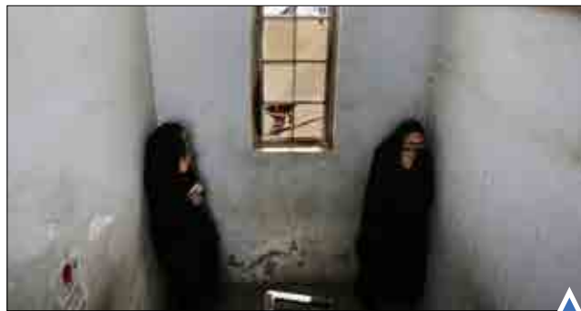
دو زن شیعه بحرینی برای در امان ماندن از گاز اشک‌آور به یک ساختمان مخروبه پناه برده‌اند.