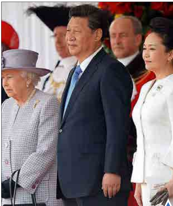
ملکه انگلیس در کاخ باکینگهام به طور رسمی از رئیس‌جمهوری چین و همسرش استقبال کرد.

بان گی مون، دبیرکل سازمان ملل متحد، روز چهارشنبه در دیدار با محمود عباس، خواستار پایان دادن به خشونت‌ها میان فلسطینیان و صهیونیستها شد.