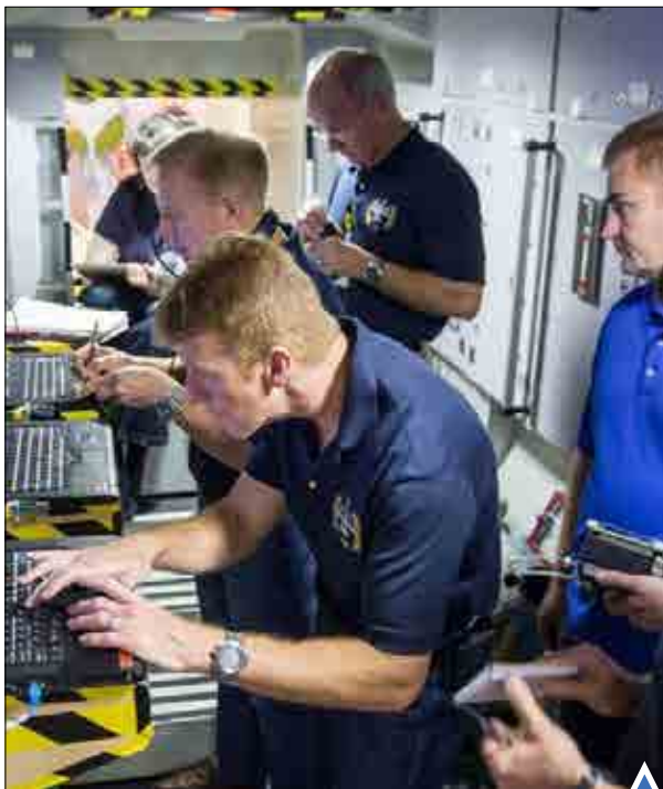
مراحل آمادگی فضانوردانی که قرار است در دسامبر امسال به ایستگاه فضایی بین المللی اعزام شوند.

نظامیان صهیونیست ورود و خروج اهالی روستای العیسایوه در شرق بیت المقدس را به شدت کنترل می کنند.