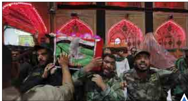
مراسم تشییع جنازه مبارزان ارتش عراق در حرم امام علی (ع) در نجف اشرف دیدار روسای جمهور چین و تایوان پس از ۶۶ سال در سنگاپور