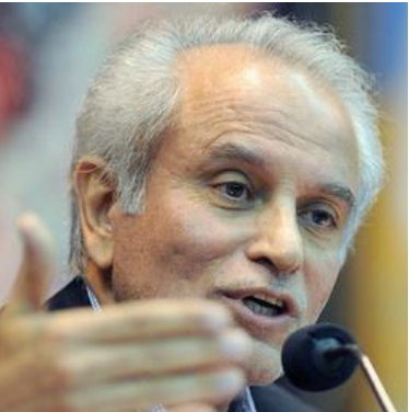
معاون وزیر ورزش و جوانان در جلسه‌اش با رئیس

دبیرکل فدراسیون فوتبال گفت: ظرف ۱۰ روز آینده نتیجه تمام بررسی‌ها درباره داوری‌های فوتبال را اعلام می‌کنیم.