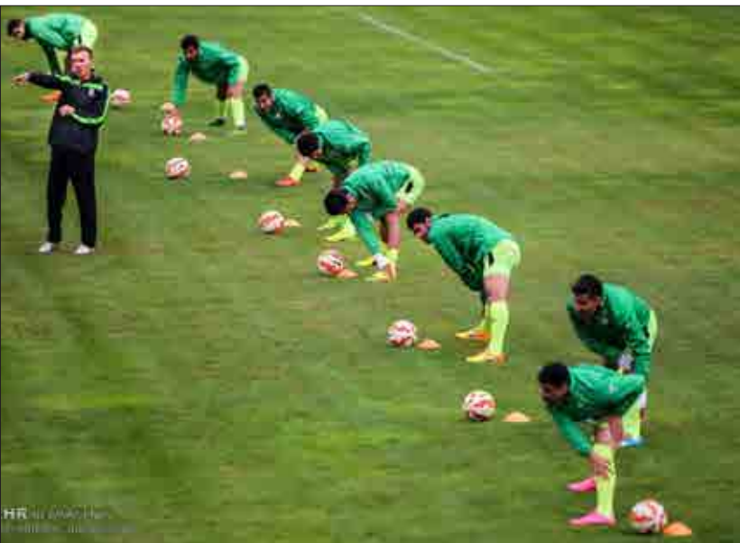
تمرین با نشاط تیم ملی در