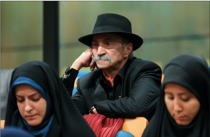
در حاشیه هفتمین