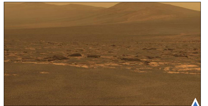
تصاویر حیرت‌انگیز ناسا از سطح مریخ که تا کنون دیدن آن برای بشر آرزو بوده است!