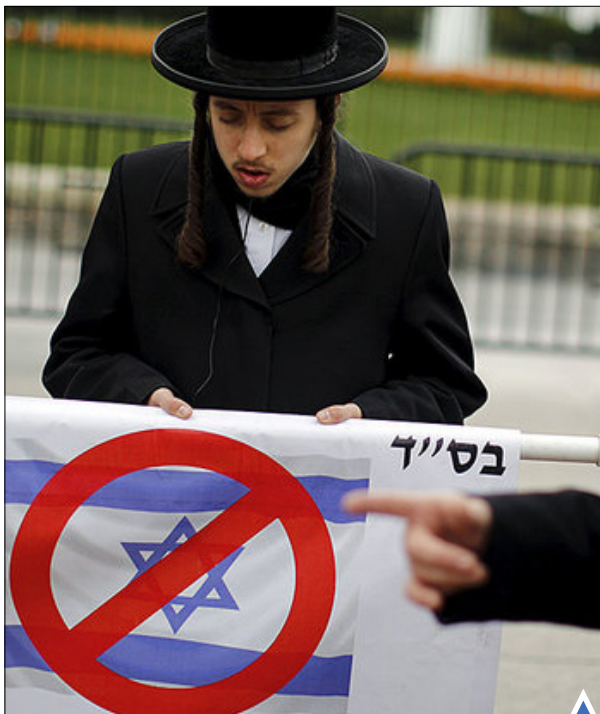
اعتراض یهودیان ارتودکس مقیم آمریکا به سفر «بنیامین نتانیاهو» و دیدار او با «باراک اوباما» در واشنگتن

اسب‌ها در مقابل کارگرانی اند که در انتظار توریست‌ها در اهرام جیزه در قاهره هستند. زغزوع وزیر گردشگری مصر از تعلیق پرواز به قاهره اظهار تأسف کرده و گفته که تمام اقدامات را برای امنیت فرودگاه‌ها و مکان‌های توریستی انجام خواهد داد.