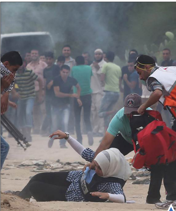
در یورش جدید صهیونیست‌ها به صفوف آزادیخواهی فلسطینیان، دست کم یک نفر شهید و ۲۰۰ تن دیگر زخمی شدند.

به این ترتیب، در حالی که مقامات حماس توانسته‌اند به راه‌حلی میانه دست یافته و دستکم به طور لفظی از انتفاضه حمایت کنند، رهبران تشکیلات خودگردان حتی در همین حد نیز موفق نبوده‌اند. نیروهای شاخه نظامی جنبش فتح در ابتدا تلاش کردند تظاهراتی را در کرانه باختری ترتیب دهند، اما به سرعت مجبور شدند خود را با موضع عباس همسو نمایند. روز بازدهم اکتبر، عباس با رهبران شاخه نظامی فتح دیدار کرد و از آن‌ها خواست اوضاع را آرام کنند. مقامات تشکیلات خودگردان به خوبی می‌دانند که اگر جنبش فلسطینی‌ها از حالت اقدامات مجزا خارج شده و شکل تظاهرات‌های گسترده و درگیری‌های دسته‌جمعی به خود بگیرد، این تشکیلات به بحرانی دچار خواهد شد که نتیجه آن را هیچ‌کس نمی‌تواند پیش‌بینی کند. اما کمترین چیزی که می‌توان در چنین شرایطی انتظار آن را داشت، این است که تشکیلات خودگردان فروپاشد و یک رهبری مردمی جای آن را بگیرد. دستیاران عباس نگران آن هستند که آنچه مردم از آن‌ها به خاطر داشته‌باشند، همکاری امنیتی با رژیم اسرائیل و دور شدن از جنبش مردمی باشد.