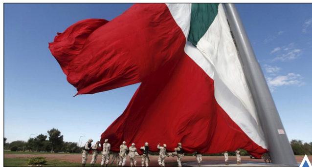
سربازان ارتش مکزیک در سیوداد خوارس پرچم این کشور را که در اثر وزش سالخورده‌ای که در لسبوس یونان به یک شدید باد آسیب دیده بود، پایین کشیدند. کودک پناهجو غذا می‌دهند.