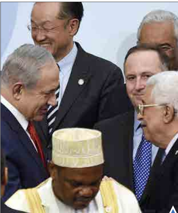
دست دادن و خوش و بش عباس و نتانیاهو در حاشیه اجلاس آب و هوا در پاریس در روز سه‌شنبه خیرساز شد!