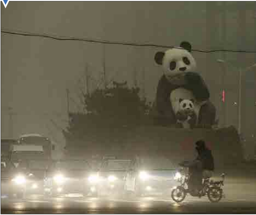
دود و مه غلیظ موجب شد آلودگی هوای پکن برای سومین روز متوالی در سطح هشدار «نارنجی» قرار بگیرد.