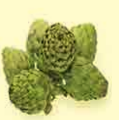
آرتیشو، گیاهی با خواص فراوان

شفای آنلین- آرتیشویا کنگر فرنگی نوعی گیاه یکساله است که بومی جنوب اروپا و کناره مدیترانه است. غنچه این گیاه خوراکی است وبیشتر به صورت آب‌پز پخته می‌شود. آرتیشو را اغلب به همراه سالاد مصرف می‌کنند. هم بصورت خام و هم آب‌پز.