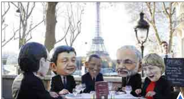
تظاهرات با ماسک سران کشورهای فرانسه، چین، آمریکا، هند و آلمان؛ مقدونیه به دلیل عدم اجازه ورود به خاک این کشور.