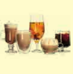
نوشیدنی‌ها می‌تواند به افزایش وزن منجر شود

تسنیم- قاصدک: این نوع چای برای افزایش وزن مناسب است. دمنوش قاصدک با ریشه این گیاه تهیه می‌شود و یک جانشین خوب است برای کسانی که قهوه می‌نوشند، چون طعم آن شبیه به قهوه است. کوشاد یا جنتیانای زرد: این نوشیدنی عالی‌ترین دمنوش برای افزایش وزن است به ویژه برای افرادی که دچار کاهش وزن ناگهانی شده اند. این چای می‌تواند به جذب غذا، ترشح اسید معده و افزایش اشتها کمک کند. شنبلیله: این گیاه حاوی