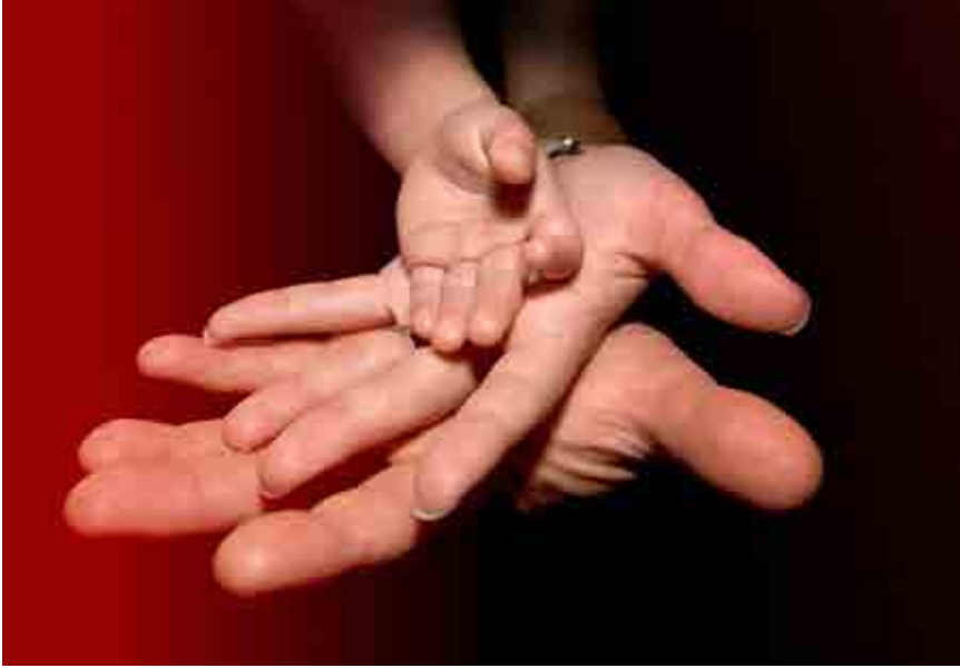
تک فرزندی می‌تواند به تضعیف روابط خانوادگی منجر شود

عوامل تهدید بنیاد خانواده ایرانی تک فرزندی است