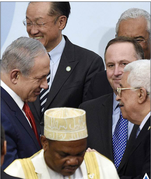
دست دادن و خوش و بش عباس و نتانیاهو در حاشیه اجلاس آب و هوا در پاریس در روز سه شنبه خیرساز شد!

دود و مه غلیظ موجب شد آلودگی هوای پکن برای سومین روز متوالی در سطح هشدار «نارنجی» قرار بگیرد.