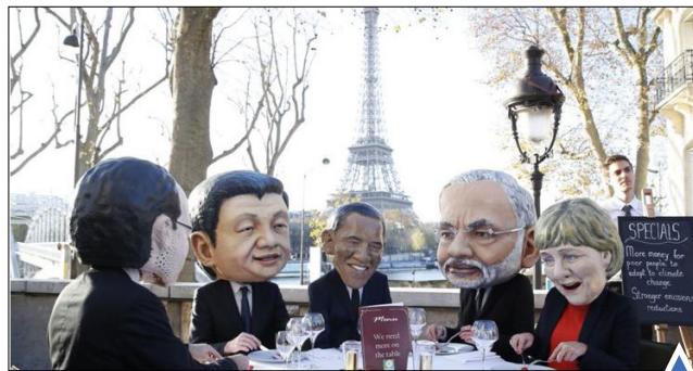
تظاهرات با ماسک سران کشورهای فرانسه، چین، آمریکا، هند و آلمان؛ مقنونه به دلیل عدم اجازه ورود به خاک این کشور.