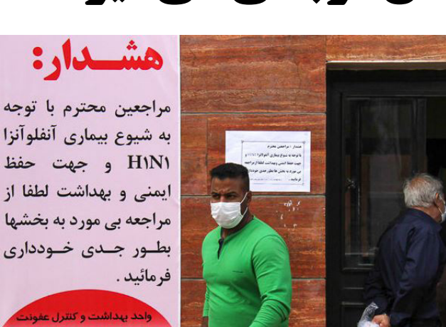
روند بهداشت و کنترل عفونت

نایب‌رئیس مجلس داد: البته آن‌چه باید مورد توجه قرار گیرد این است که تحریم‌ها ۲۰ تا ۴۰ درصد مشکل را حل می‌کند و ۶۰ تا ۷۰ درصد باقی‌مانده نیازمند تدبیر و خرد است و باید با شجاعت در این زمینه اقدام کرد.