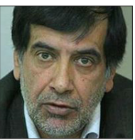
نایب رئیس مجلس شورای اسلامی

نایب رئیس مجلس شورای اسلامی ایراز امیدواری کرد که موضوع پی‌ام‌دی طرف چندروز آینده حل شود.