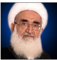
آیت الله العظمی خاмене‌ای

حساست بسیاری است، عنوان کرد: وضع جهان امروز بسیار متفاوت است زیرا فاجعه‌های بسیاری برای دنیای اسلام به‌وجود آمده است. وی با یادآوری اینکه امروز لشکرکشی دشمنان به عراق انجام‌شده است، گفت: این دشمنان به‌دنبال اهداف خود در این کشور هستند که باید در این موضوع هوشیار بود.