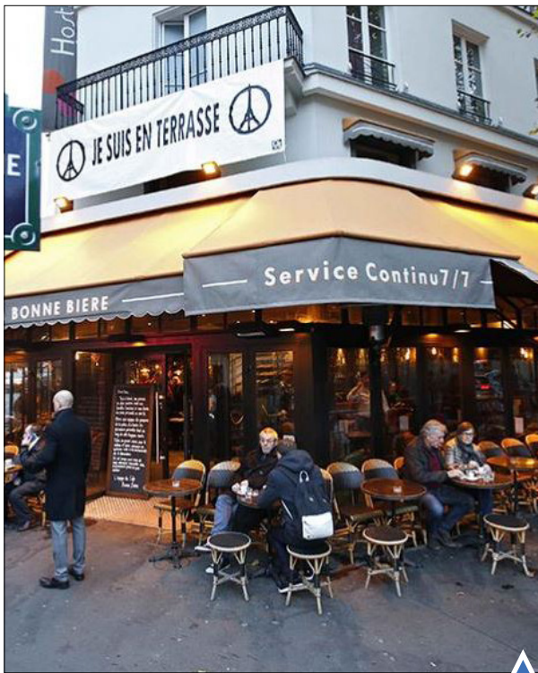
سه هفته پس از حملات مرگبار پاریس 'کافه «لا این بی بی» بازگشایی شد.

همه ساله حدود ۱۲۰ میلیون خرچنگ قرمز در جزیره کریسمس در استرالیا با بیرون آمدن از جنگل به سمت اقیانوس آرام مهاجرت می‌کنند.