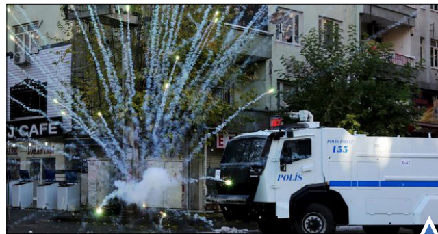
درگیری معترضان و پلیس ضد شورش در ترکیه. مراسم روشن کردن شمع در آغاز جشن کریسمس در کلمبیا.