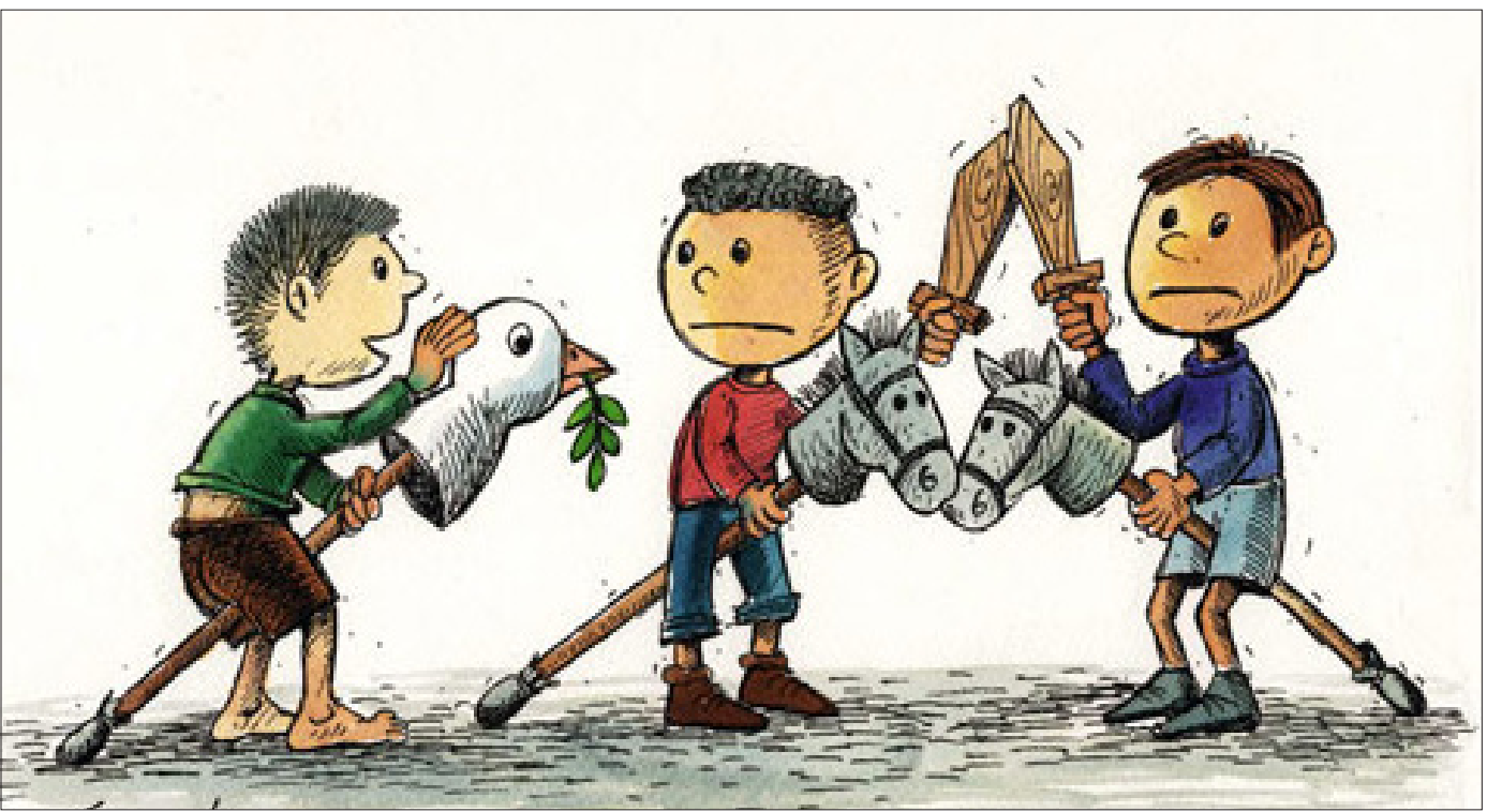
و هیچ کس نمی‌دانست که نام آن کیوتو غمگین کز قلب‌ها گریخته ایمان است... (فروغ فرخزاد) طرح: سعید صادقی