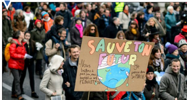
اعتراض مردم ژنو به مصرف بی‌رویه منابع طبیعی در سوئیس.