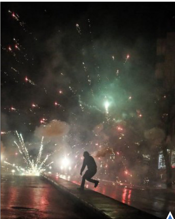
پلیس ترکیه با استفاده از گاز اشک آور معترضان را متفرق می‌کند.

پیاده روی مسلمانان برای رسیدن به مراسم اربعین حسینی در کربلا.