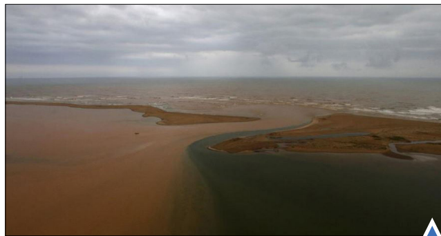
رودخانه ریو برزیل بعد از خشک‌شدن شدن سد.