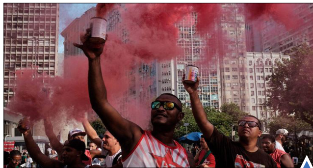
تظاهرات حامیان حزب کارگر و رئیس جمهور سابق برزیل، دیلما روسف؛ ریودوژانیرو.