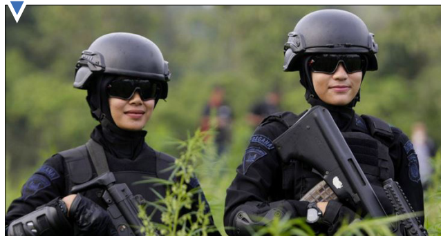
پلیس مبارزه با مواد مخدر در اندونزی.