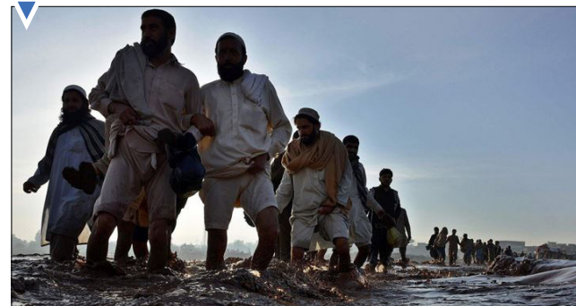
جاری شدن سیل در پیشاور پاکستان.