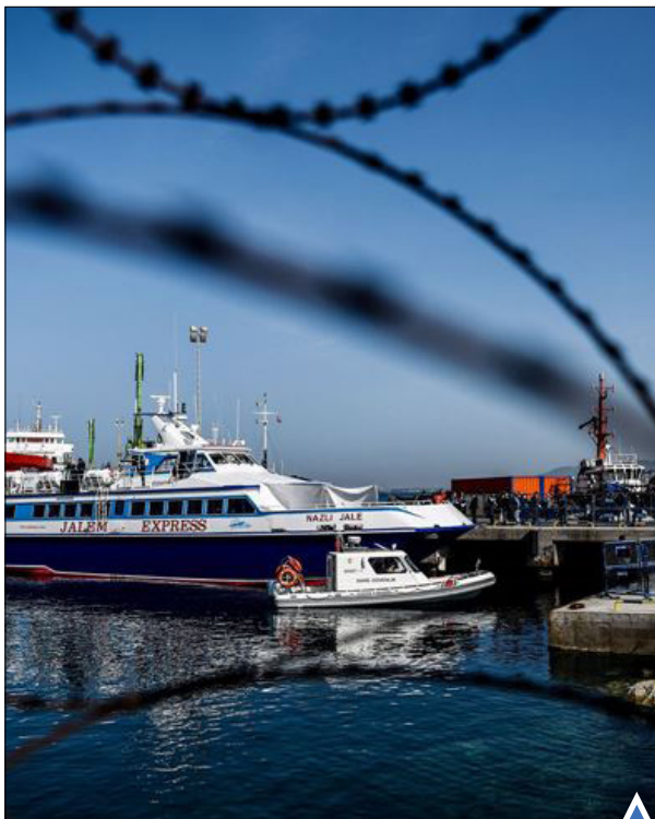
کشتی بازرگاندان مهاجران از یونان به ترکیه؛ از میر.

گفتنی است در آخرین تحول، بعد از ظهر امروز، وزارت دفاع منطقه خودمختار ناگورنو قره‌باغ اعلام کرد که آذربایجان و ارمنستان بر سر آتش بس توافق کردند و نیروهای نظامی این منطقه آن را اجرا خواهند کرد. وزارت دفاع قره‌باغ همچنین اعلام کرده که «به ما دستور داده شده است عملیات نظامی را متوقف کنیم». سخنگوی وزارت دفاع ارمنستان نیز با تأیید این موضوع گفت که مقدمات برقراری آتش بس در حال انجام است.