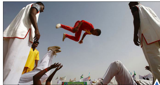
شکار لحظه هنگام اجرای حرکات آکروبات در جریان بازدید رئیس‌جمهور سوئدان.