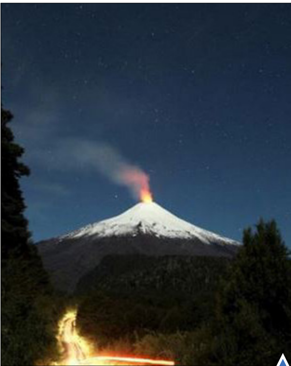
عکاسی با سرعت نوردهی بالا از جاده و قلعه آتشفشان «ویبلر» در شیلی