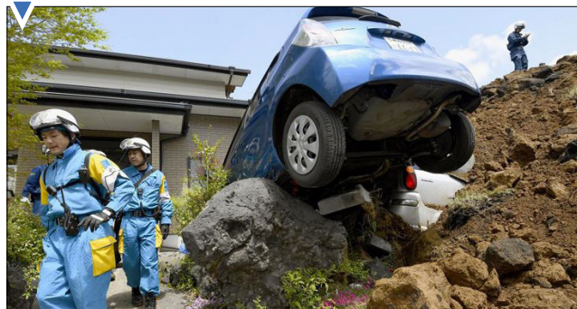
جستجوی گروه امداد در محل وقوع زلزله؛ استان کومامونو، ژاپن