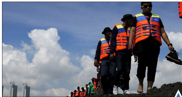
گشت نیروهای امنیتی پس از تظاهرات ماهیگیران در جاکارتا، اندونزی