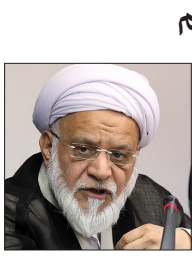
که ما ارائه کردیم این لیست درست است

که حاصل ائتلاف بود اما لیستی بود که قابلیت تخریب بالایی داشت و دیدم که این تخریب خیلی قوی صورت گرفت، به حساب این که عده ای که در این لیست هستند تندرو هستند و مخالف برجام هستند تمام لیست را کوبیدند حال آن که هم از نقطه نظر گروه رقیب هم افراد معتدل در لیست بود هم افرادی که آن‌ها تعبیر به تندرو می‌کنند.