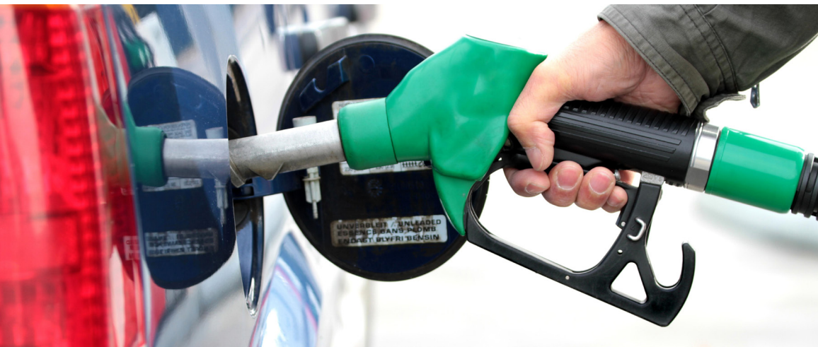
هفته گذشته نمایندگان مجلس شورای اسلامی، مصوبه ای را درباره افزایش