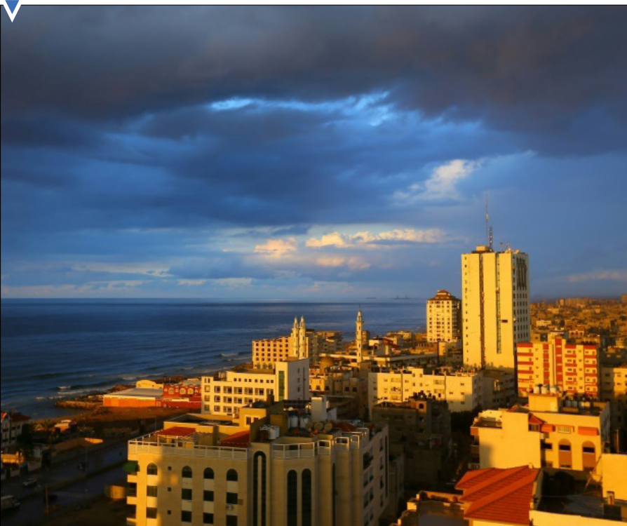
غروب آفتاب در شهر غزه.