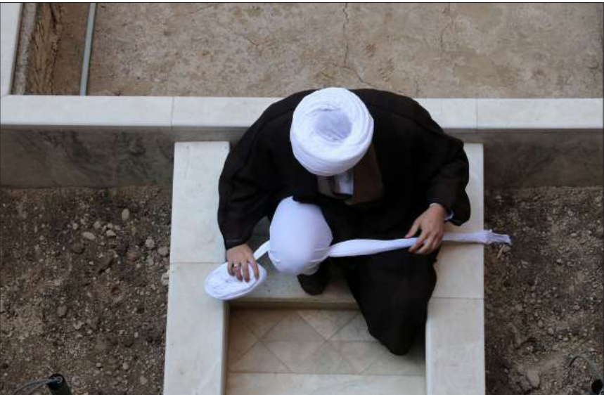
مراسم عمامه گذاری طلبه های مدرسه علمیه بقیة الله (عج) در مشهد برگزار شد.