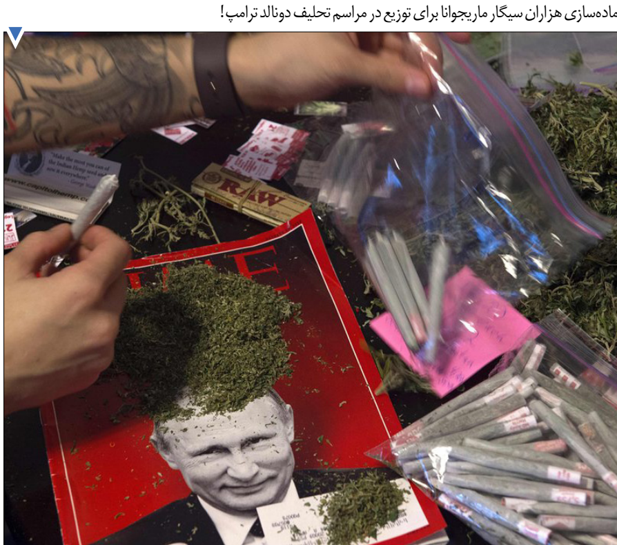
آماده‌سازی هزاران سیگار ماریجوانا برای توزیع در مراسم تحلیف دونالد ترامپ!