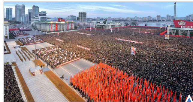
راهپیمایی مردم کره شمالی در حمایت از کیم جونگ اون