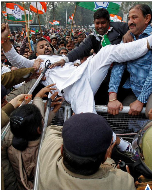
برخورد پلیس با معترضان هوادار حزب اپوزیسیون پاکستان