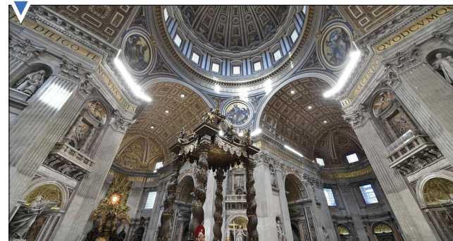
انجام مراسم عشاى ربانى توسط پاپ فرانسیس