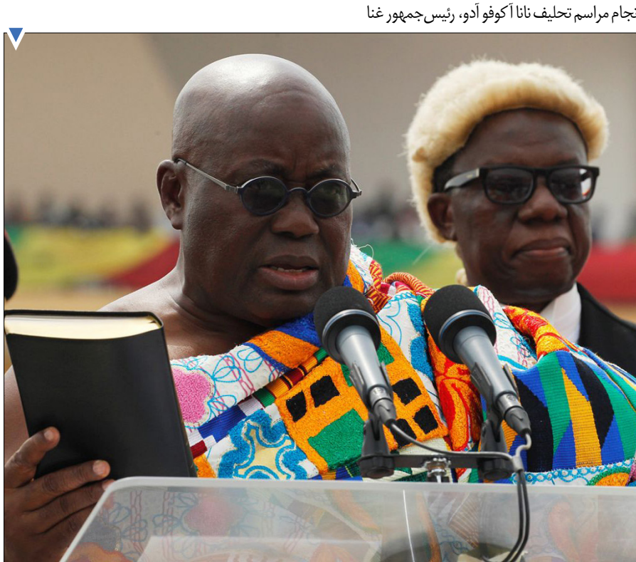
انجام مراسم تحلیف نانا آکوفو آدو، رئیس‌جمهور غنا