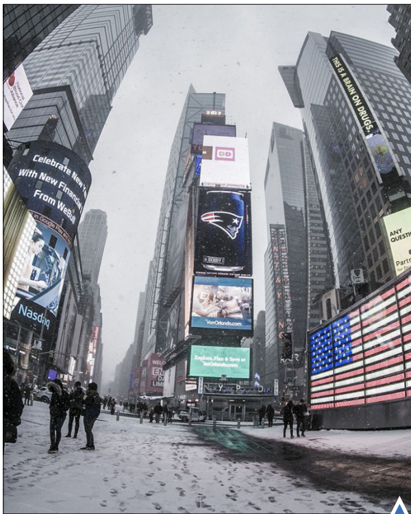
نمایی از یک روز برفی در میدان تایمز نیویورک