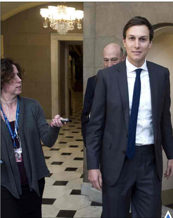
جرد کوشنر، داماد و مشاور دونالد ترامپ در حال ورود به ساختمان کنگره

نمایی از معبد «پارتون» آتن در پی بارش کم‌سابقه برف در این شهر