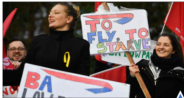
اعتصاب خدمه پروازهای «بریتیش ایرویز» حضور آندرس بریویک، جنایتکار نروژی در گلاسکو اسکاتلند در دادگاه تجدیدنظر