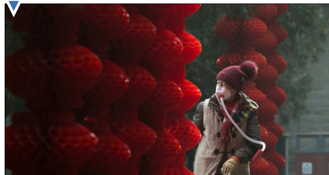
تزیینات سال نوی چینی با چاشنی آلودگی در پکن