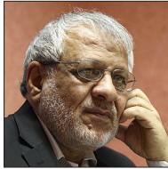
اسدالله بادامچیان نایب‌رئیس شورای مرکزی