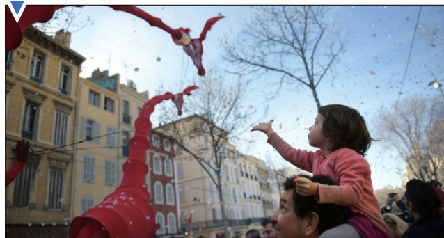
تماشای زرافه شناور در رژه در ماریسی