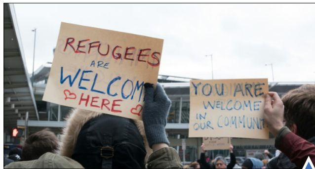
تظاهرات علیه ترامپ در فرودگاه جان اف کندی