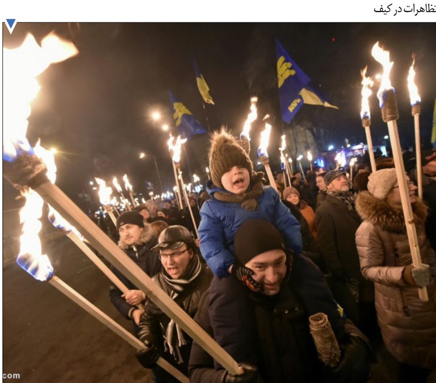
تظاهرات در کیف