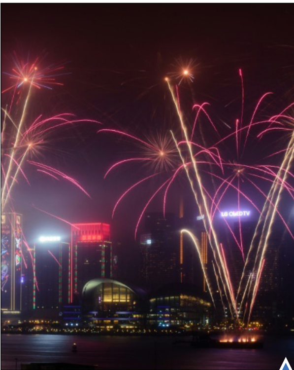
آتش‌بازی در هنگ کنگ