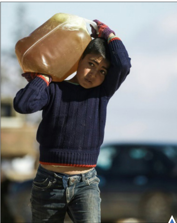
کودک آواره عراقی در اردوگاه