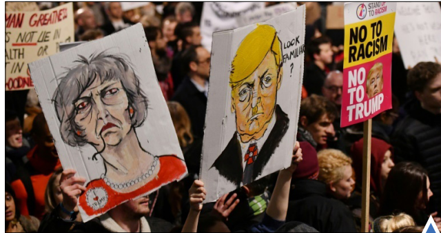
تظاهرات در اعتراض به سفر ترامپ به انگلیس در لندن تصادف شدید با ۶۵ مجروح در فرانسه