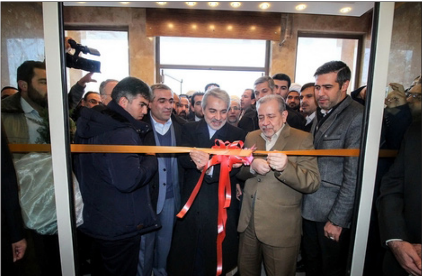
محمد باقر نوبخت