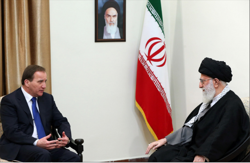
دیدار نخست وزیر سوئد با رهبر معظم انقلاب