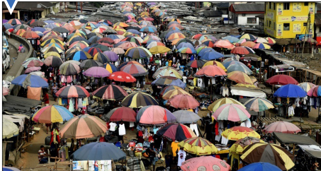
در ست موریتز روز بارانی در نیجریه