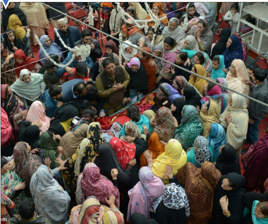
تشییع یکی از قربانیان بمب گذاری در لاهور