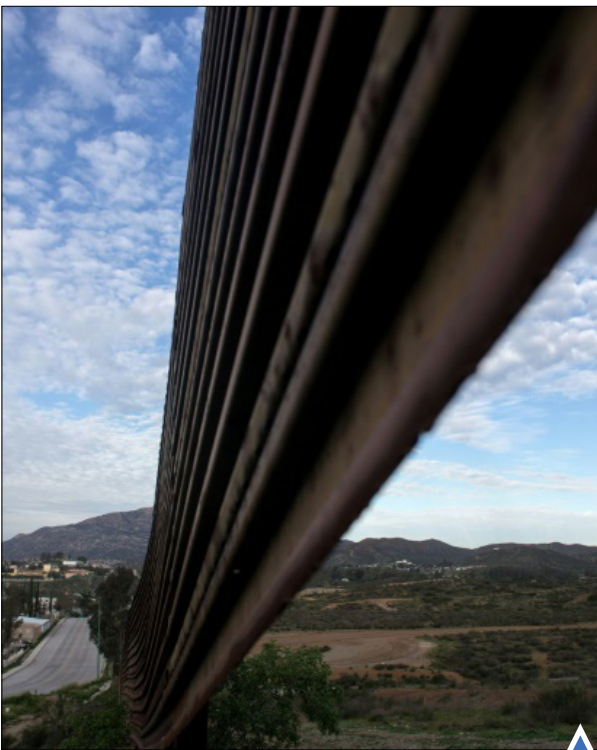
حصار مرز آمریکا - مکزیک